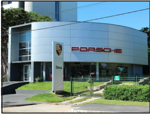
North East View