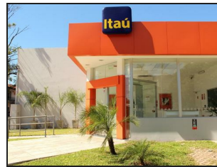
Main Entrance Detail