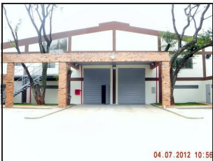
Main Building Front View

Project and construction of Interpan's Bread factory under HACCP standards.