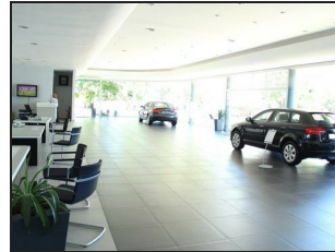
Opposite view Inside