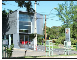
Main Entrance view