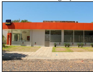
View from Kennedy street