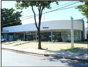
View from St. Martin Ave.

Project for reform and construction for Audi dealer in Asuncion - Paraguay