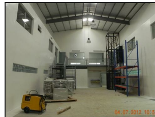
Inside Building View